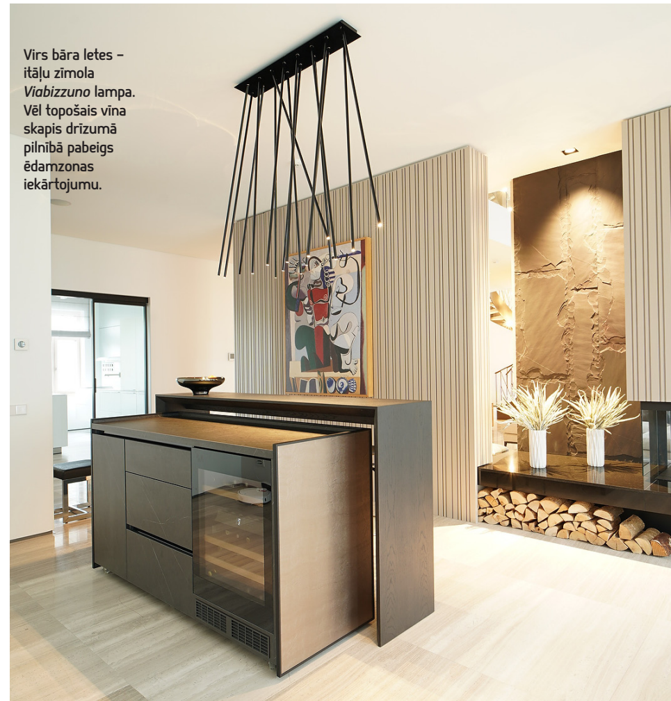
Virš bāra letes – itāļu zīmola Viabizzuno lampa. Vēl topošais vīna skapis drīzumā pilnībā pabeigs ēdamzonas iekārtojumu.