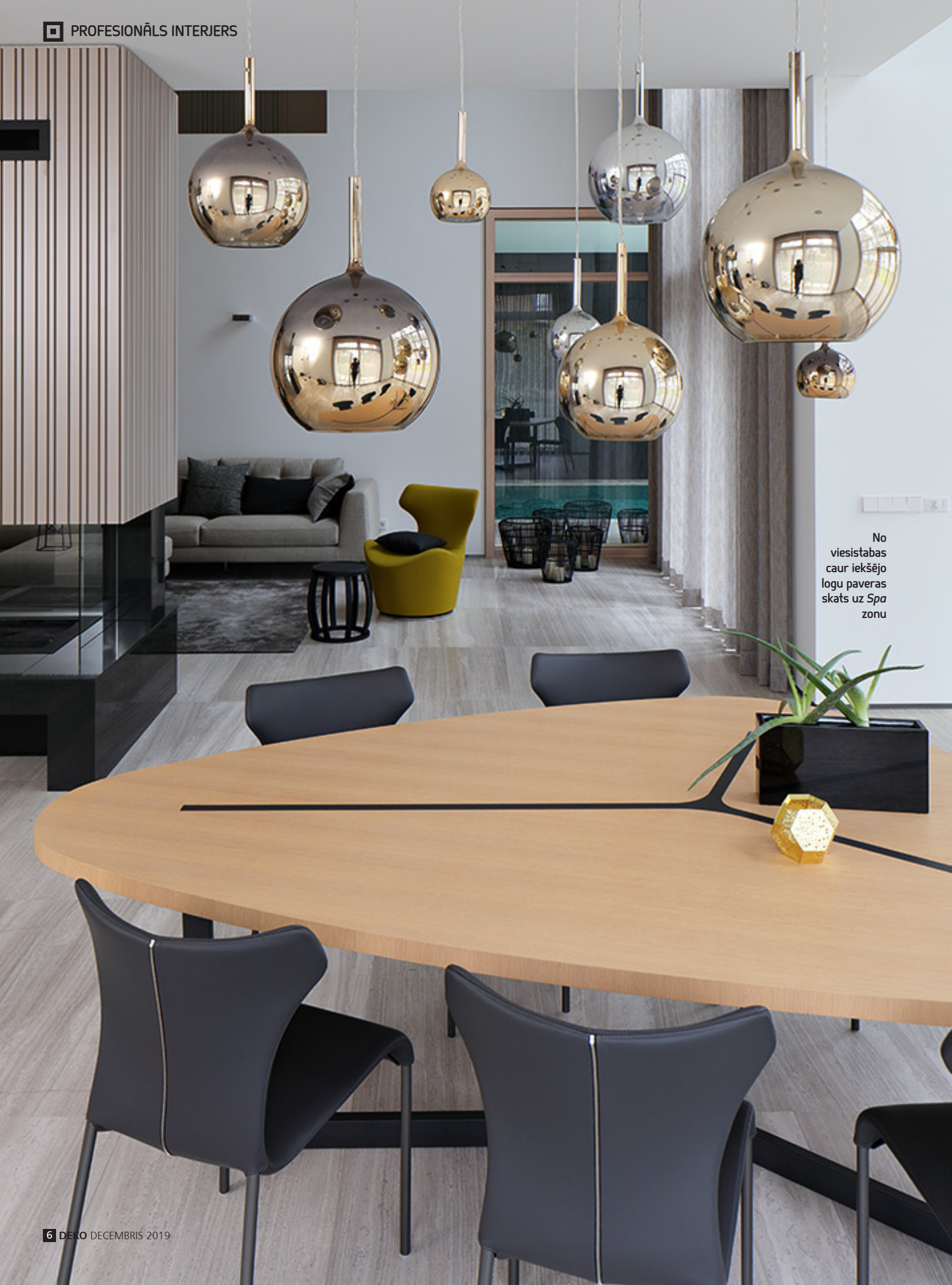
No viesistabas caur iekšējo logu paveras skats uz Spa zonu