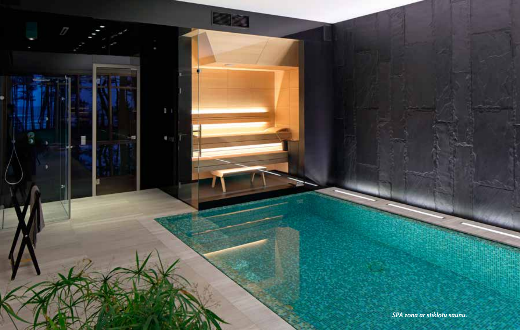
SPA zona ar stiklotu saunu.

dekoriem, kā arī rafinētiem mākslinieciskiem ornamentiem, kas ēkas gaisotni padara izteikti izsmalcinātu. Baseina telpā valda kontrasti, vienā virzienā peldētajam caur stiklojumu pavēras skats uz jūru, bet, apmetot loku, aci piesaista melna siena ar izteiksmīgu faktūru, kuru laukumos sadala lielgabarīta fli-