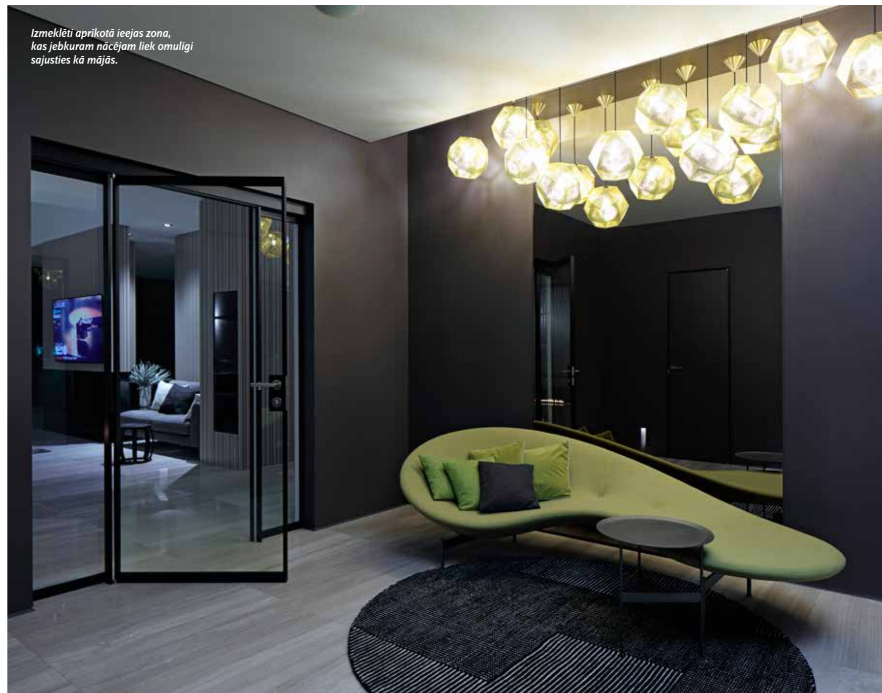
Izmeklēti aprīkotā ieejas zona, kas jebkuram nācējam liek omulīgi sajūties kā mājās.