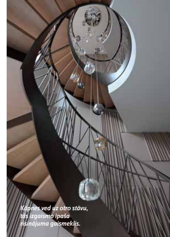
Kāpnes ved uz otro stāvu, tās izgaismo īpaša risinājuma gaismekļis.