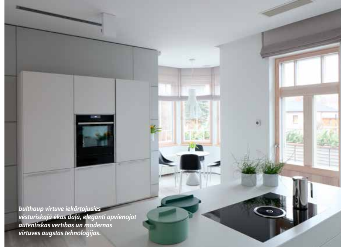
bulthaup virtuve iekārtojusiēs vēsturiskajā ēkas daļā, eleganti apvienojot autentiskas vērtības un modernas virtuves augstās tehnoloģijas.