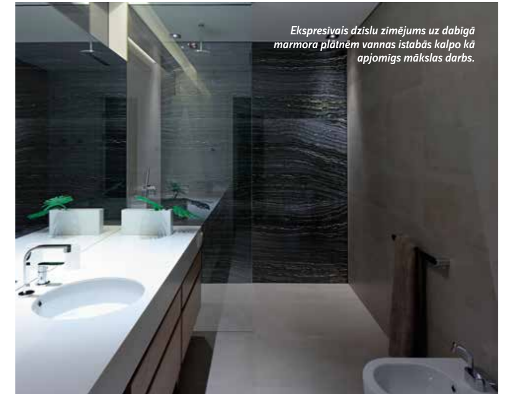
Ekspresīvais dzīslu zīmējums uz dabīgā marmora plātnēm vannas istabās kalpo kā apjomīgs mākslas darbs.