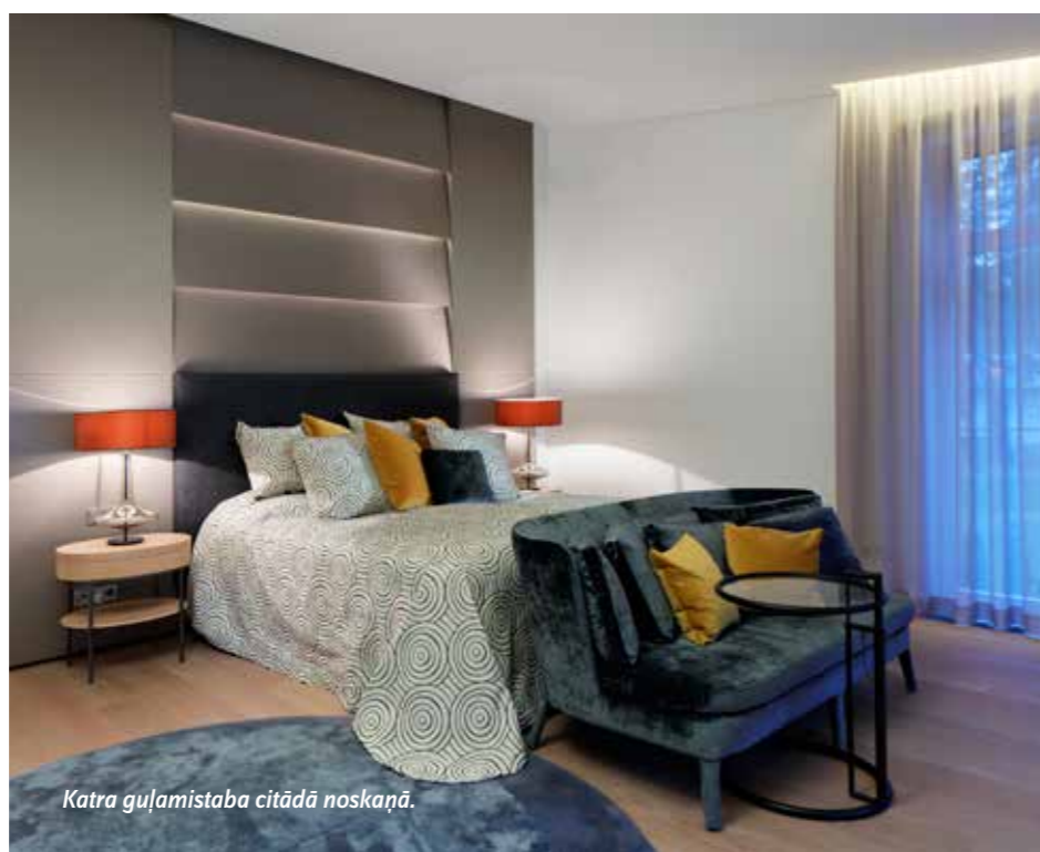
Katra guļamistaba citādā noskaņā.

kādu daiļdarbu no plašās mājas bibliotēkas. Jāatzīmē, ka guļamistabas veidotas ar savdabīgu, atšķirīgu emocionālo noskaņu, kur tonējums tendēts ar atsaucēm uz dabīgiem materiāliem, ietekmējoties no jūras un pludmales daudzveidīgās krāsu gammas. Pirmā stāva līmeni uz abām pusēm ap ēku izveidota labiekārtota ārtelpa, kas organiski pāriet dārzā, bet otrajā stāvā no terases paveras gleznains skats uz jūru. Dārzs ap māju veidots vienotā ansambli ar arhitektūru, ielas pusē nedaudz konkurējot ar vēsturisko fasādi. Reprezentatīvo terasveida dārzu veido klasiskās tradīcijās cirpti skujuņi kombinācijā ar ziedu laukumiem. Ēkas otrā pusē dārza tēlā tiek akcentēts jūras tuvums ar mežonīgākiem un dabiskākiem laukumiem, uz kuru fona naksnīgajā laikā izceļas izgaismoto priežu siluete. Atgriežoties pie mājas dekoratīvajā apdarē izmantotajiem materiāliem, pamanāmas faktūras, kas ekspresīvi izceļ robusto dabīgo materiālu izteiksmīgumu - deļu grīdas ar dziļa profila zāģējumu, plēsta akmens sienas baseinā. Šīs faktūras tiek konfrontētas ar metāla