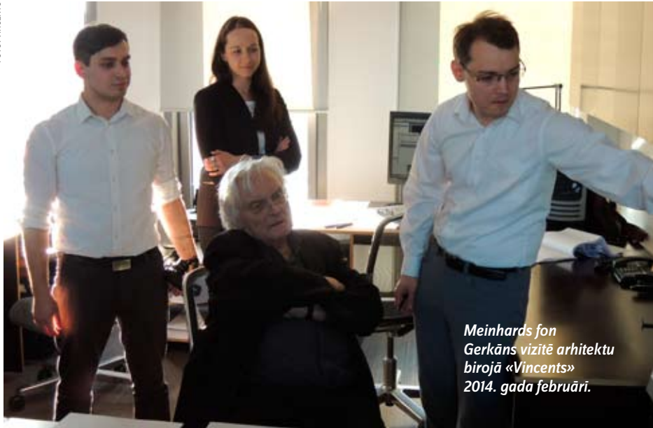
Meinhard von Gerkan vizītē arhitektu birojā «Vincents» 2014. gada februārī.

tikumi, tādi kā uzticamība, konceptuālā domāšana, precīzs plānojums un tā īstenošana Brazīlijā tiek augstu vērtēti un apbrīnāti, tomēr tas ne vienmēr saistās ar pastāvošo pragmatisko ikdienas praksi. Izaicinājums ir tas, ka, atrodoties starp divām pasaulēm, ir jārikojas veikli, jāizmanto sinerģija un jāapvieno labākais, kas ir abās pasaulēs. Tas izdodas labāk, ja arhitektam piemīt pētnieka gars un laba humora izjūta. Jūsu kompānijas interneta lapā starp 17 valstīm Latvija ir reprezentēta ar 8 projektiem. Arhitektu birojs «Vin-