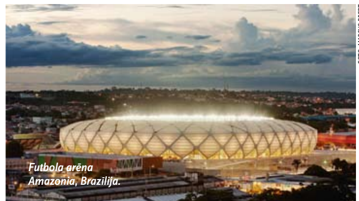
Futbola arēna Amazonia, Brazīlija.