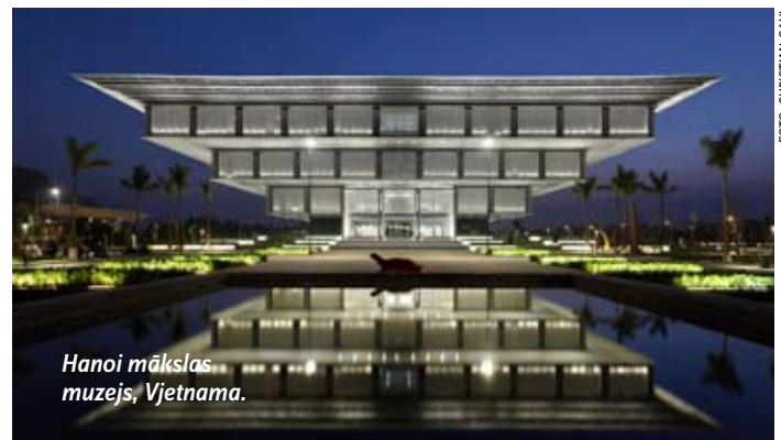
Hanoi mākslas muzejs, Vjetnama.