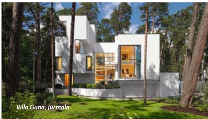
Villa Guna, Jūrmala.