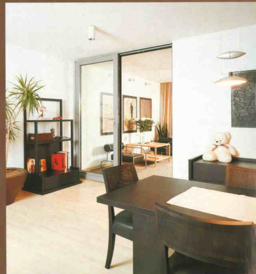
Внизу Столовая. За перегородкой—кабинет. Стол, стулья, Maxalto. Светильник, Tobias Grau (2)