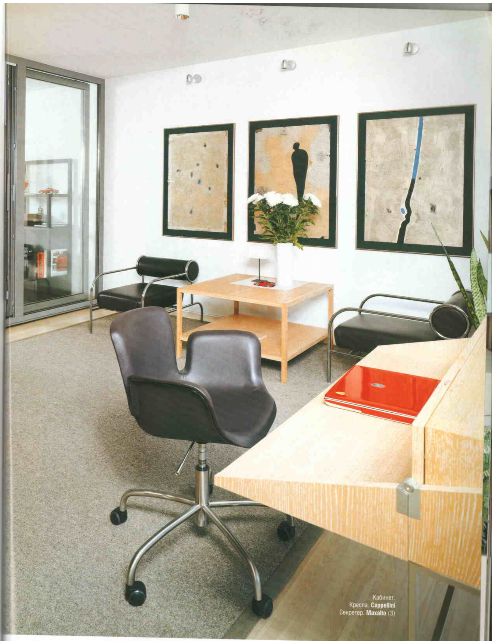
Кабинет. Кресла, Cappellini. Секретер, Maxalto (3)