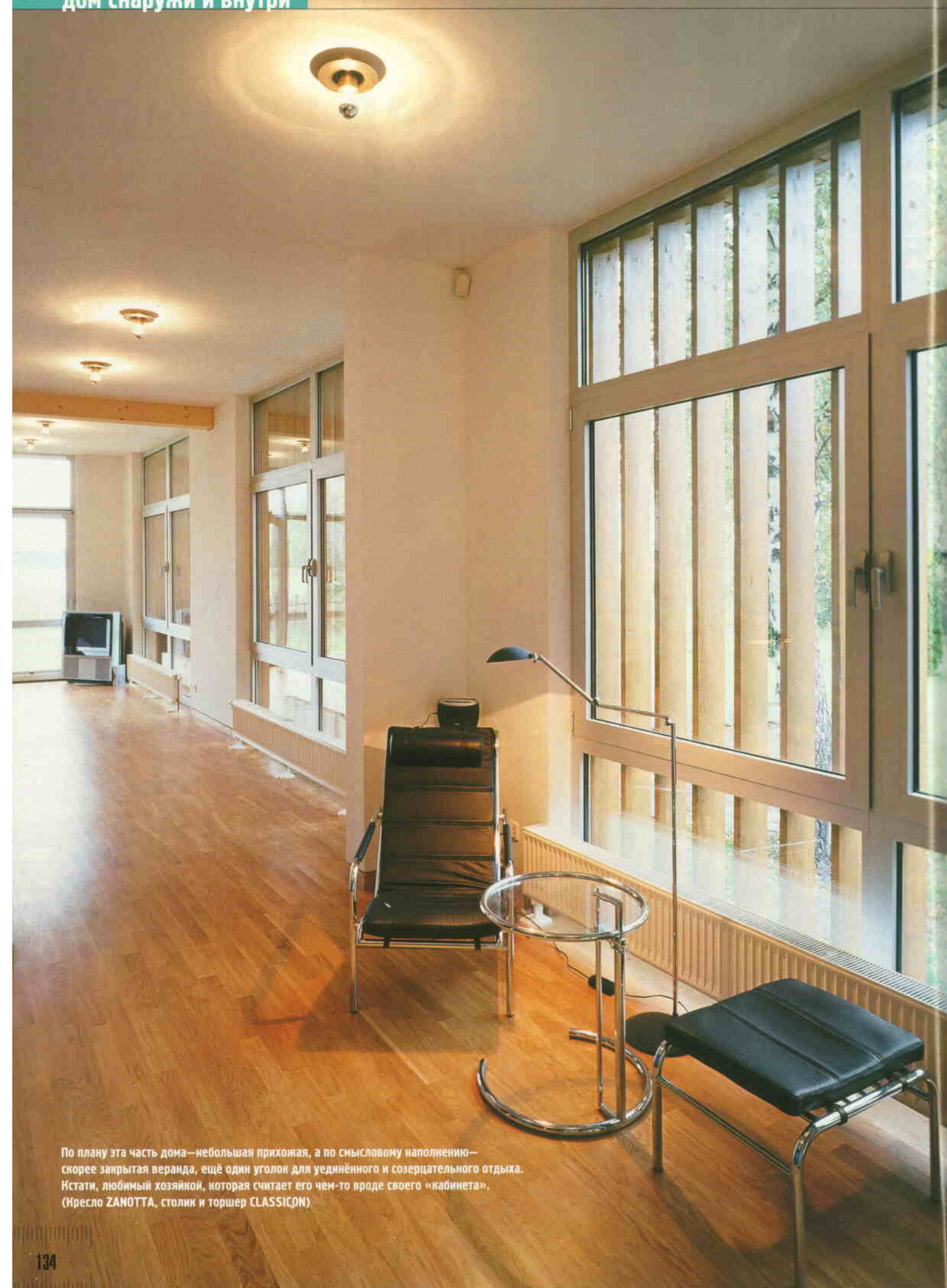
По плану эта часть дома—небольшая прихожая, а по смысловому наполнению—скорее закрытая веранда, ещё один уголок для уединённого и созерцательного отдыха. Кстати, любимый хозяйкой, которая считает его чем-то вроде своего «кабинета», (Кресло ZANOTTA, столики и торшер CLASSICON)