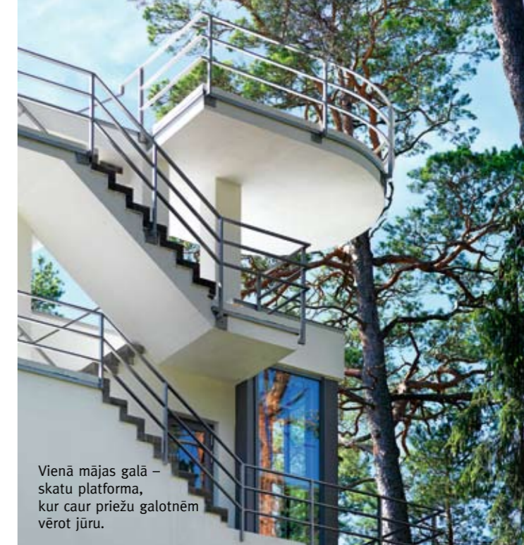
Vienā mājas galā – skatu platforma, kur caur priekšu galotnēm vērot jūru.