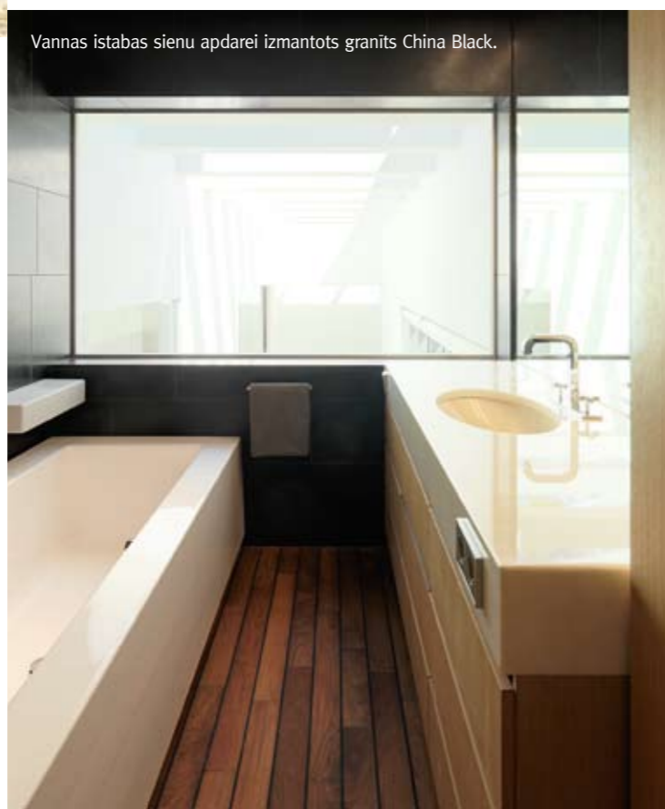
Vannas istabas sienu apdarei izmantots granīts China Black.

Izvēloties par savas dzīves telpas vidi villu, būtu mazliet liekulīgi teikt, ka tur viss ir racionāls un praktisks. Villai jābūt arī gana reprezentatīvai un jāpiedāvā vide, kura ir kas krietni vien vairāk par tikai funkcionāli apdzīvotiem kvadrātiem. Arhitekts arī atzīst, ka, projektējot villu Guna, priekšplānā nav izvirzīta funkcionalitāte, bet gan šeit izbūvējamais pārdzīvojamais, skaistums un pat arhitektoniska eksotika. Villas galvenā arhitektoniskā intriga atrodas tās iekšpusē. Tie ir pandusi, kas savstarpēji savieno dažādus ēkas līmeņus. Protams, tiem atvēlēto telpu varētu izmantot racionalāk, taču tieši šī villas daļa rada arhitektūras greznības un telpiskā plašuma vērienīgo iespaidu. Lēnā pārvietošanās no viena stāva uz otru īpaši uzsver Guna būtisko telpu līdzenu pārplūšanu no vienas otrā, veidojot vienotu mājas vidi. Jāpiebilst, ka daļā telpu nokļūt no stāva uz stāvu var arī ātrāk – sienā iestiprinātas teju nemanāmas kāpnēs, kuru pakāpieni vizuāli dažādo sienas plakni, ne-