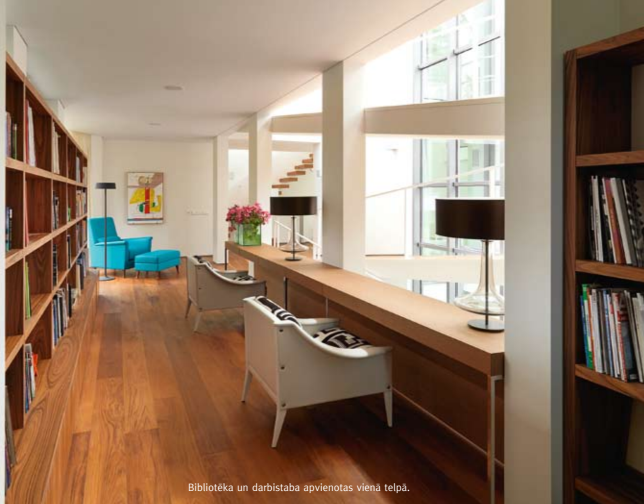
Biblioteka un darbistaba apvienotas vienā telpā.