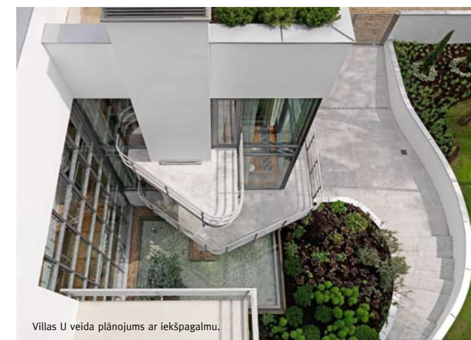
Villas U veida plānojums ar iekšpagalmu.