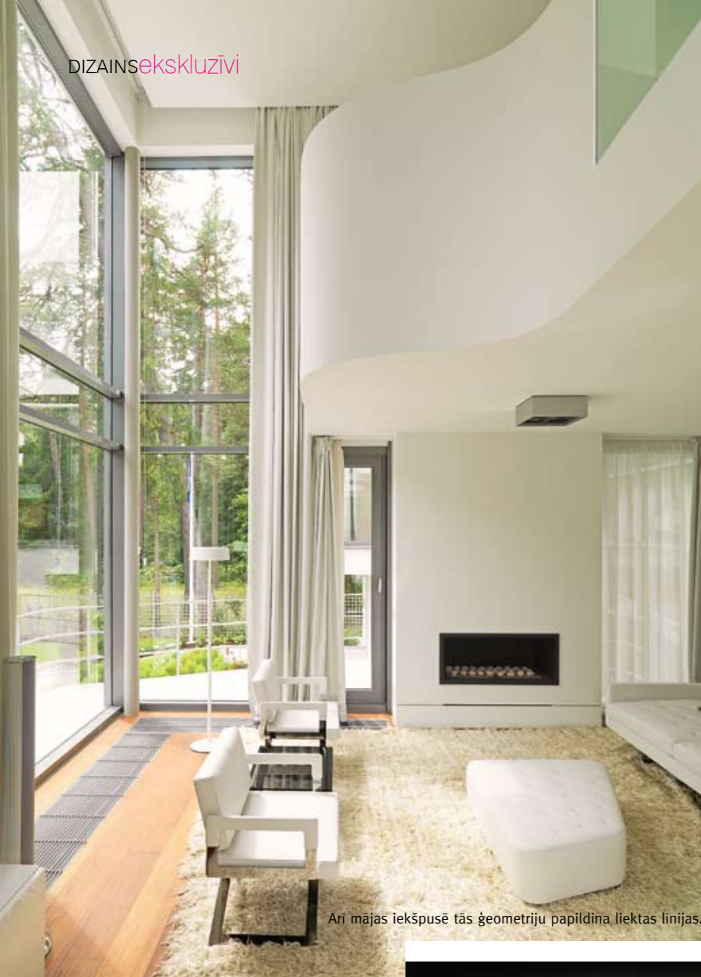
Arī mājas iekšpusē tās ģeometriju papildina liektas līnijas.

uzsverot savu praktisko noslogojumu. Atvērtais plānojums villā nenozīmē visu sadzīvē nepieciešamo funkciju apvienošanu vienā lielā telpā bez vai tikai ar daļējiem norobežojumiem. Villā Guna atvērtais plānojums ir atsevišķu telpu klusināts pārplūdums no vienas otrā. Ēkas veidola pamata skaidro ģeometriju mājas iekšpusē ik pa laikam atdzīvina kāda vijīga forma, piemēram, skulpturāls iekšējais balkons vai sienas izliekums, vai ēkas apjoma liektas līnijas atkārtojums interjerā.