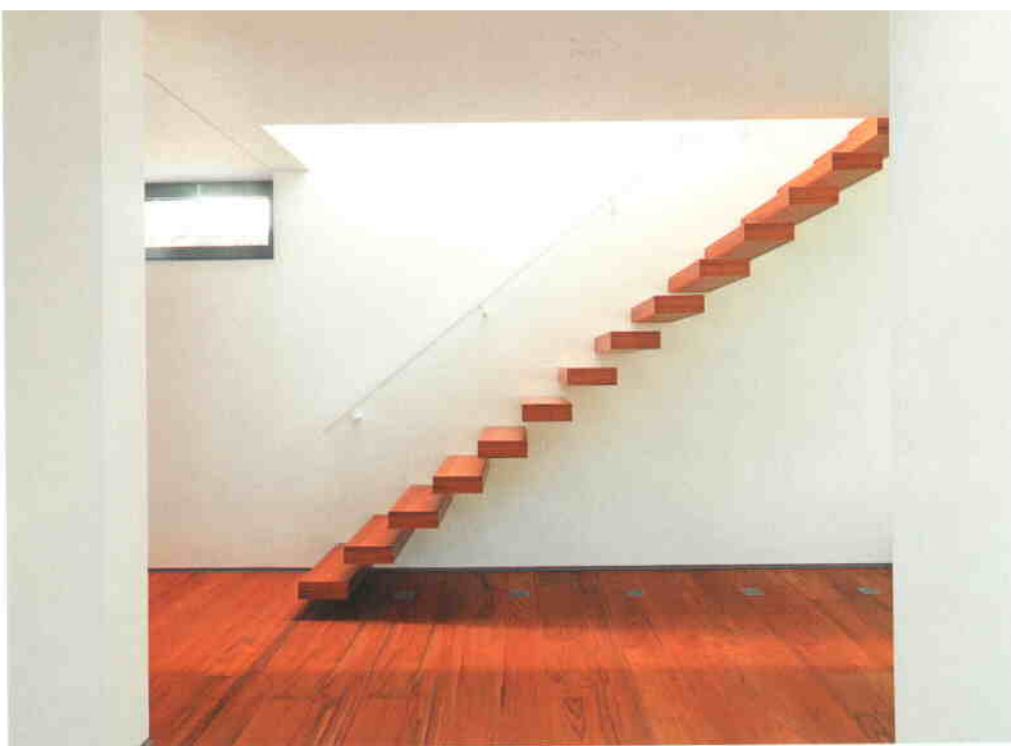
Лестница как эффектный дизайнерский объект.