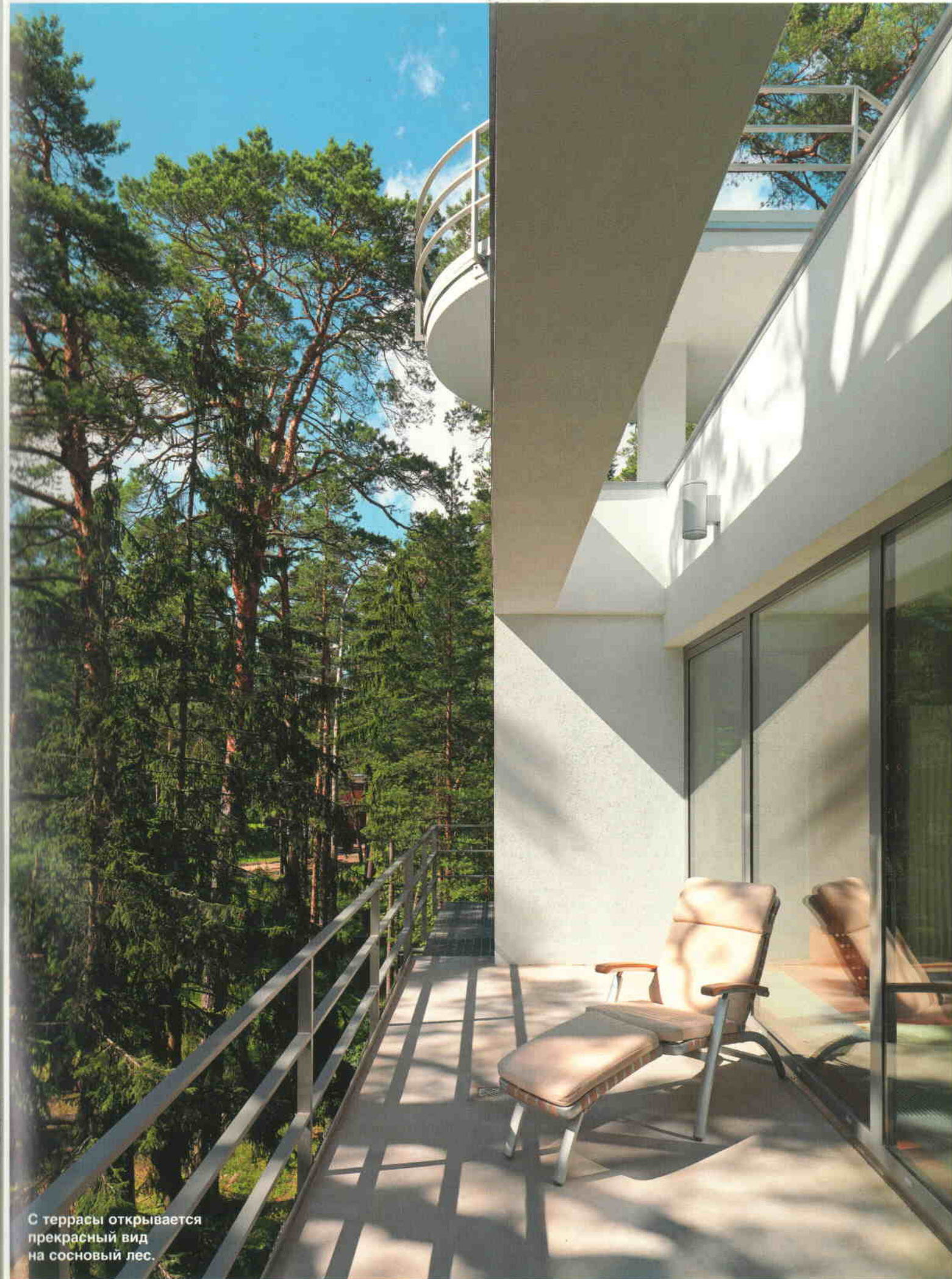
С террасы открывается прекрасный вид на сосновый лес.