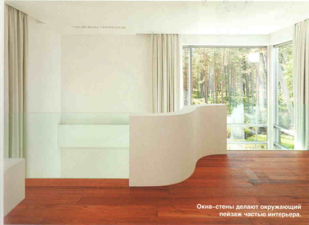
Окна-стены делают окружающий пейзаж частью интерьера.