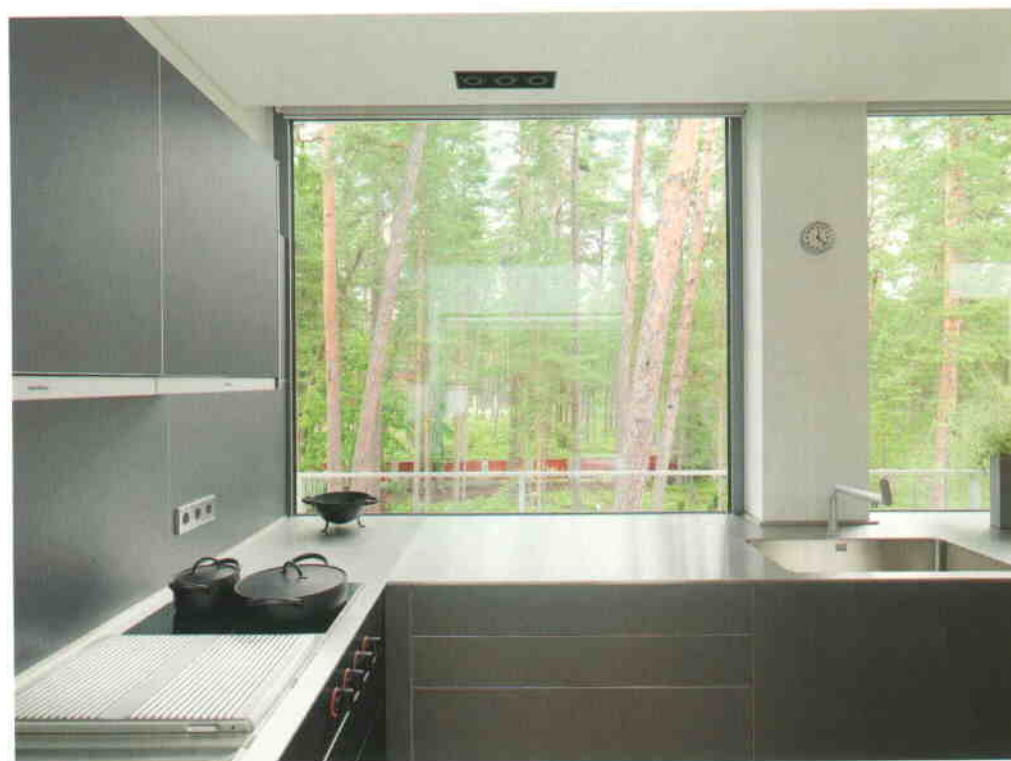
Кухня: красота чистых линий и минималистских форм.

как и архитектурное решение всей виллы. В этой же стороне здания, только уровнем ниже, располагается зона активного отдыха и релаксации — бассейн и джакузи с обширным видом на лесной пейзаж. В свою очередь с другой стороны пандуса и атриума находится зона отдыха — спальни хозяев и гостей. Здесь особенно позаботились об удобстве — в спальни можно попасть и по пандусу, и