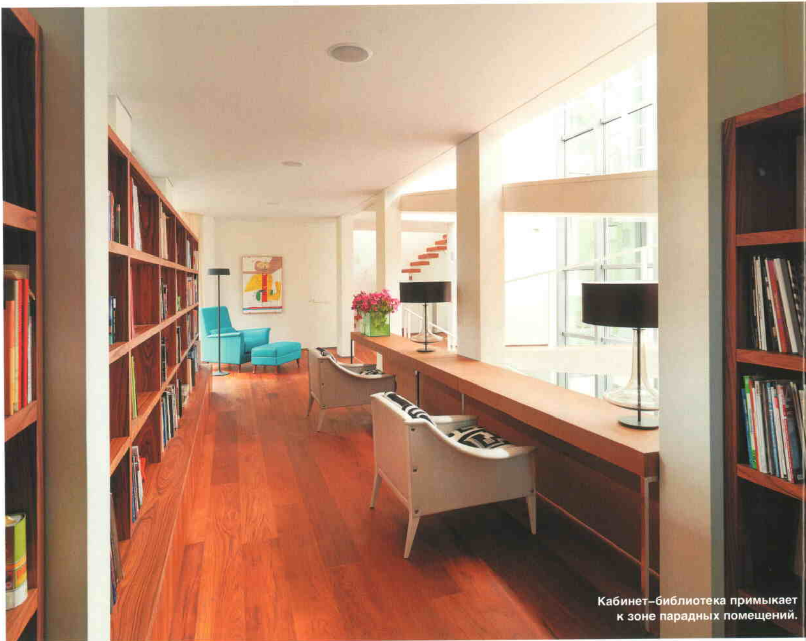
Кабинет-библиотека примыкает к зоне парадных помещений.