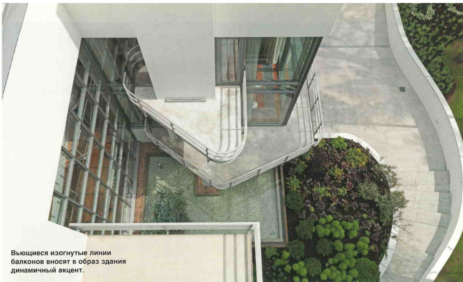
Вьющиеся изогнутые линии балконов вносят в образ здания динамичный акцент.