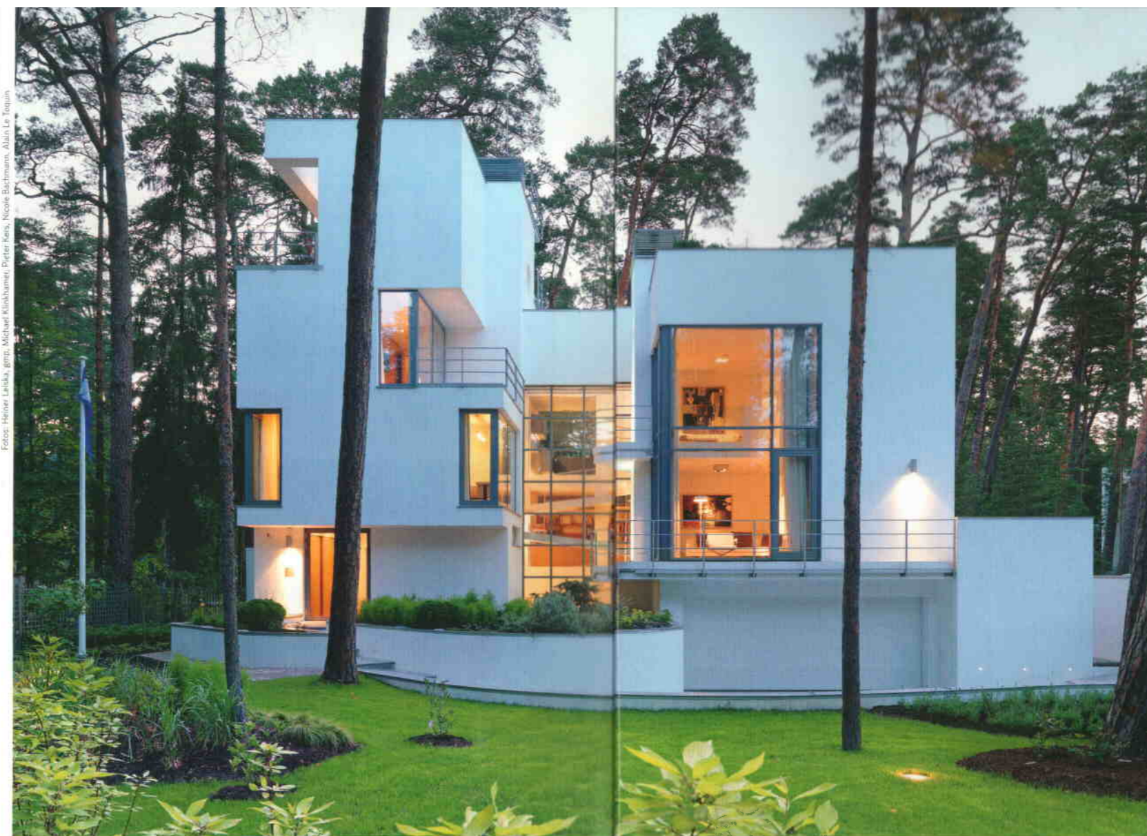
MEISTERHAUS Diese Villa am Ostseestrand von Riga entwarf Meinhard von Gerkan als Hommage an das Bauhaus, das 1919 gegründet wurde. HAUSER widmet dem Jubiläum ein ganzes Heft.

Abonnement Deutschland HAUSER Abo-Service, 20080 Hamburg, Jahrespreis: 48,00 Euro inkl. MwSt. und frei Haus Abo-Bestellservice Tel. 018 05-861 80 00* Fax 018 05-861 80 02* Abo-Kundenservice Tel. 018 05-861 80 01* Fax 018 05-861 80 02* persönlich erreichbar: Mo-Fr 7.30-20 Uhr, Sa 9-14 Uhr abo-service@guj.de www.haeuser.de/abo 24-Std.-Online-Kundenservice: www.meinabo.de/service Abonnement Österreich HAUSER Abonentenservice, Postfach 5, 6960 Wolfurt, Jahrespreis: 49,80 Euro inkl. MwSt. und frei Haus, Tel. 08 20-00 10 85, Fax 08 20-00 10 86, haeuser@abo-service.at Abonnement Schweiz HAUSER Leserservice, Postfach, 6002 Luzern, Jahrespreis: 93,00 CHF inkl. MwSt. und frei Haus, Tel. 041-329 22 09, Fax 041-329 22 04, haeuser@leserservice.ch Abonnement übriges Ausland HAUSER Leserservice, Postfach, CH-6002 Luzern, Preise im Ausland auf Anfrage, Tel. +41-41-329 22 80, Fax +41-41-329 22 04, haeuser@leserservice.ch Bestellung von Ausgaben der letzten zwei Jahre HAUSER Versandservice, 20080 Hamburg, Tel. 018 05-861 80 00*, Fax 018 05-861 80 02*, heft-service@guj.de Bestellung Bücher und Sammelschuber HAUSER Versandservice, 44281 Dortmund, Tel. 01 80-506 20 00*, Fax 01 80-508 20 00*, service@guj.com *14 Cent/Min. aus dem dt. Festnetz, Mobilfunkpreise können abweichen