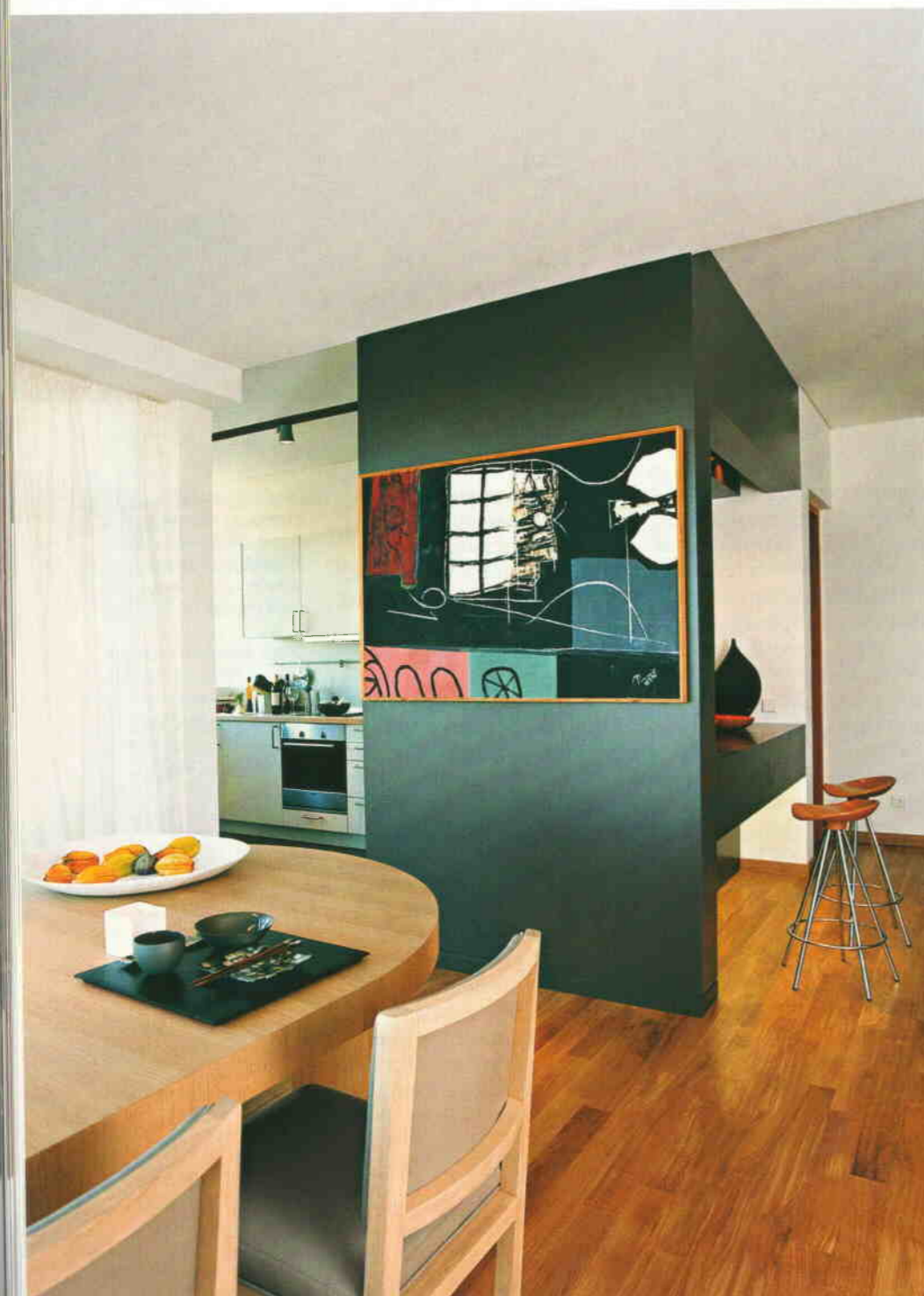
Слева Конструкция, разделяющая кухню и гостиную, служит одновременно и окном, и барной стойкой, и системой хранения. Барные стулья, Amal-3 (6)