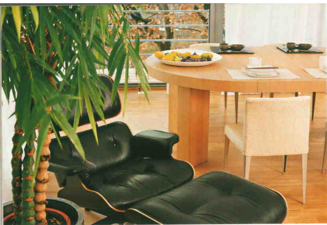
Вверху В столовой дизайнер Гуна Эглите создала вокруг кресла Имсов небольшой оазис. В кадке растёт бамбук. «Мейнхард фон Геркан строит очень много зданий в Китае. Именно благодаря ему мы так полюбили это растение», — говорит она (5)