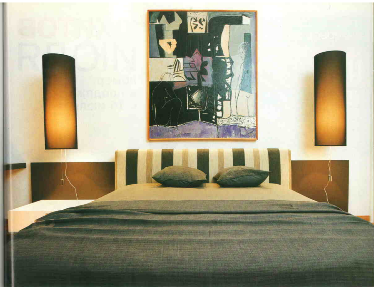
Вверху Спальня оформлена в столь характерной для этой квартиры природной гамме. Встроенный шкаф, кровать, B&B Italia (7)