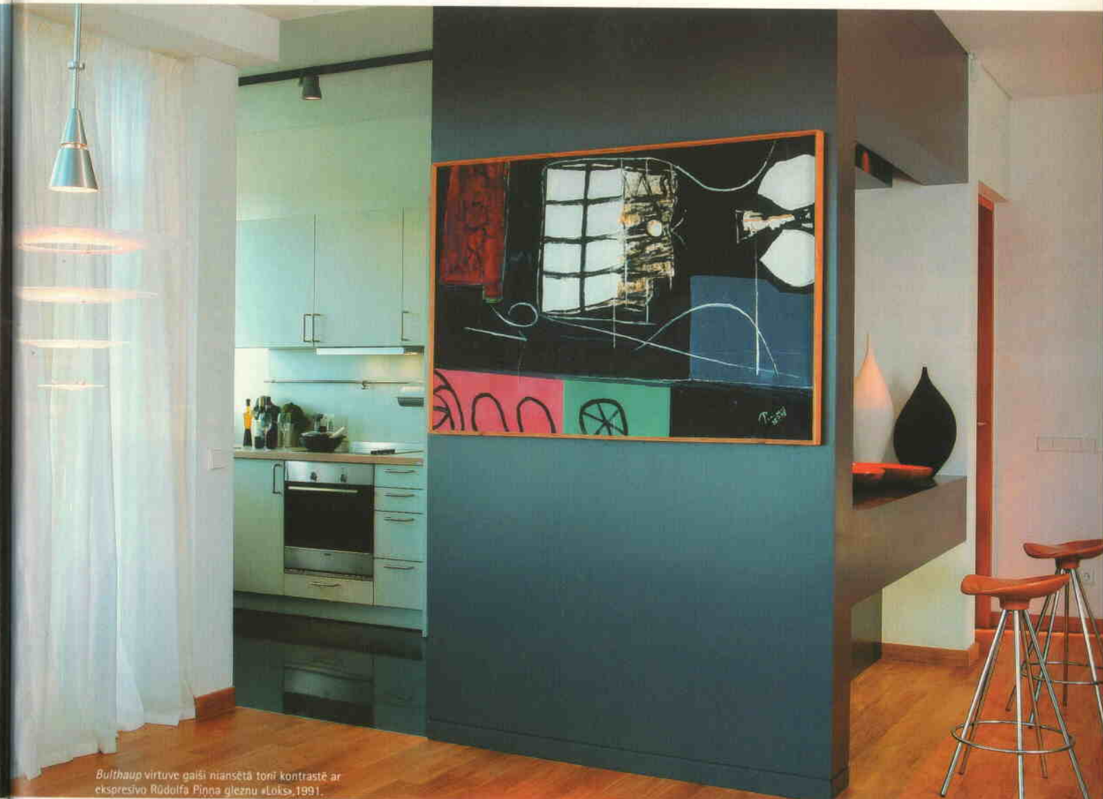
Bulthaup virtuve gaiši niansētā tonī kontrastē ar ekspresīvo Rūdolfa Piņa gleznu «Lok», 1991.