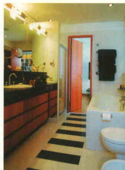
Bisazza grīdas klājuma un ķirškoka mēbeļu stingrā ģeometrija, ko papildina striktā stilā ieturēti Agape vannasistabas gaismekļi un aksesuāri.