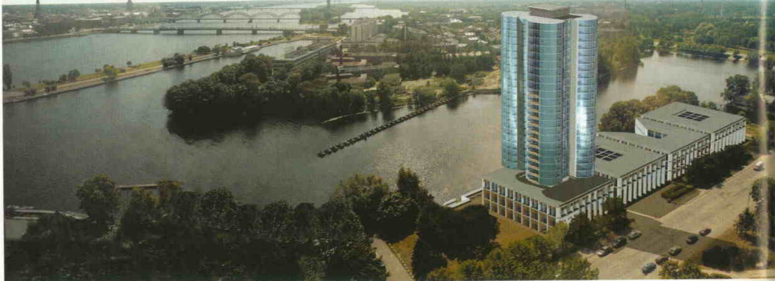
AUGŠĀ Augstceltne Balasta dambī 9. Vizualizācija.*