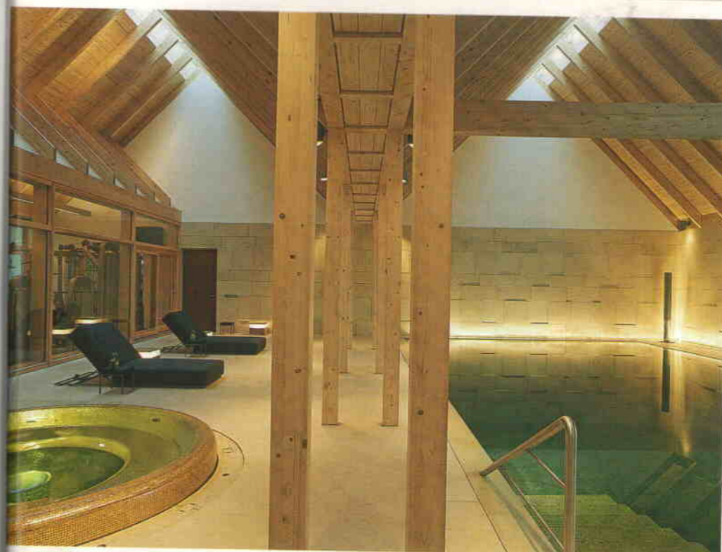
Baseina telpas grīdas klājumā izmantotas Vičenzas akmens plāksnes. Šī paša materiāla dažādu lielumu plāksnes, iepriekš apstrādātas ar smilšu strūklu, reljefi klātas arī uz sienām, ļaujot apgaismojumam veidot ēnu rakstu, kas sasaucas ar vēja sapūstu jūrmalas smilšu viļņojumu. Atspulgs baseinā ir meditāciju vērts. Baseina un džakuzi apdarē mīrgulo 24 karātu lapu zelta mozaika, bet baseina malā cienīgi izgūlušies Antonio Čiterio dizainētie zvilņņi no Maxalto Smplicitē kolekcijas (ražotājs B&B Italia).