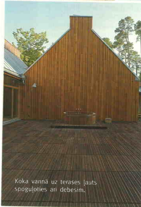
Koka vannā uz terases ļauts spoguļoties arī debesīm.